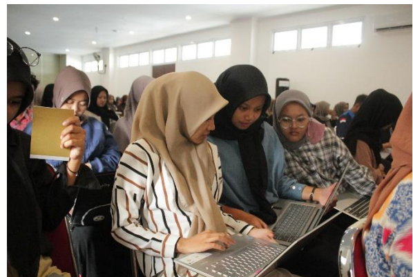
Gambar 2. Pelatihan