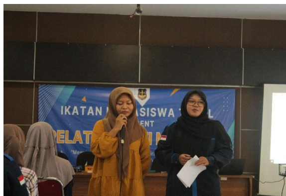
Gambar 3. Tanya Jawab