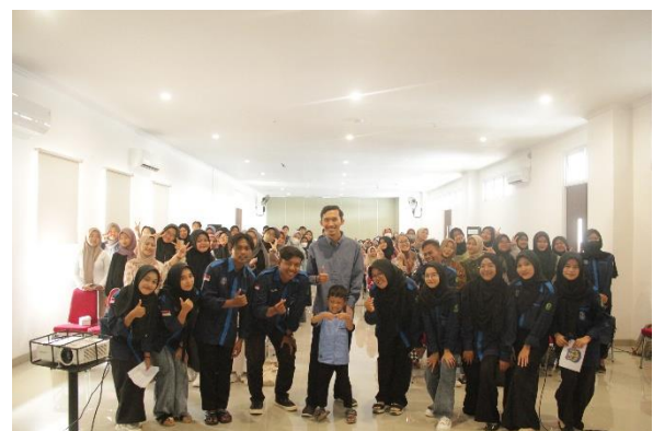
Gambar 4. Foto Bersama