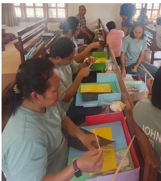
Gambar 5. Praktik Pembuatan Diorama

Sesi berikutnya berfokus pada praktik pembuatan media diorama dengan tema kisah penciptaan berdasarkan Kejadian 1. Peserta membuat miniatur tiga dimensi dari setiap tahapan penciptaan menggunakan bahan sederhana seperti kardus, plastisin,