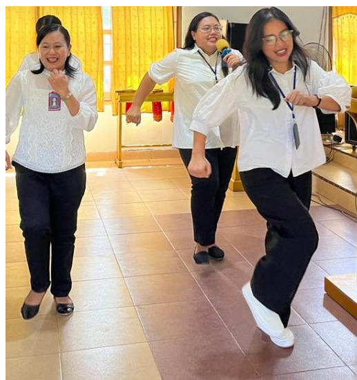
Gambar 6. Games Kreatif dari Tim Pkm

Rangkaian kegiatan PkM ini didesain untuk menumbuhkan kesadaran, keterampilan, dan motivasi baru bagi pelayan sekolah minggu untuk mengajar dengan cara yang lebih kreatif, komunikatif, dan kontekstual sesuai dengan kebutuhan anak-anak sekolah minggu di gereja masa kini.