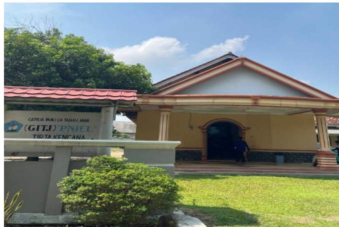
Gambar 10. Gitj Pniel Tirta Kencana, Lokasi PKM

Demikianpula setelah pembuatan diorama, setiap peserta diberi kesempatan untuk mensimulasikan alat peraga yang sudah dibuat dan Tim PkM memberi hadiah kecil sebagai apresiasi kinerja peserta PkM yang memuaskan. Di bawah ini kami menampilkan lokasi kegiatan PkM yang dilaksanakan di GITJ Pniel