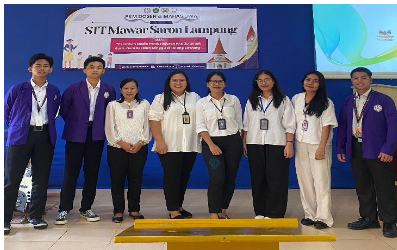
Gambar 11. Tim PkM STT Mawar Saron