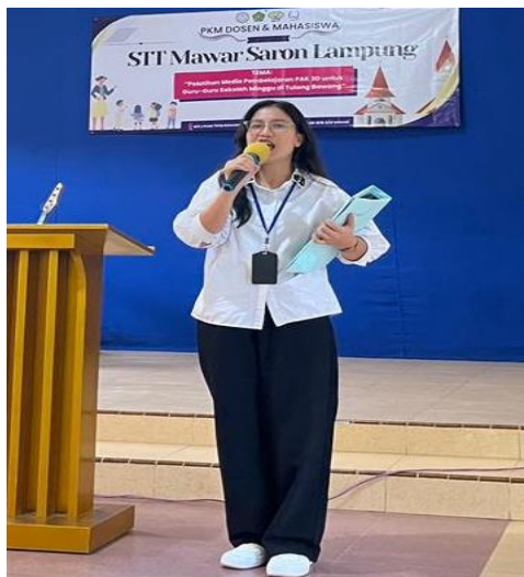
Gambar 2. Simulasi Pop up

Kegiatan kedua adalah simulasi interaktif, yaitu praktik bercerita Firman Tuhan dengan menggunakan teknik komunikasi ekspresif dan responsif yang dilengkapi dengan alat peraga 3D. Peserta dilatih untuk menghidupkan kisah Alkitab melalui intonasi suara, ekspresi wajah, dan gerak tubuh yang menarik. Dalam sesi ini, para Tim PkM berperan sebagai pencerita dan Peserta PkM berperan sebagai audiens (anak-anak sekolah minggu). Peserta dapat mengevaluasi gaya penyampaian pencerita. Kegiatan ini memberikan pemahaman praktis bahwa efektivitas mengajar di sekolah minggu tidak hanya ditentukan oleh materi, tetapi juga oleh kemampuan guru dalam mengomunikasikan pesan iman dengan cara yang menggugah dan kontekstual.