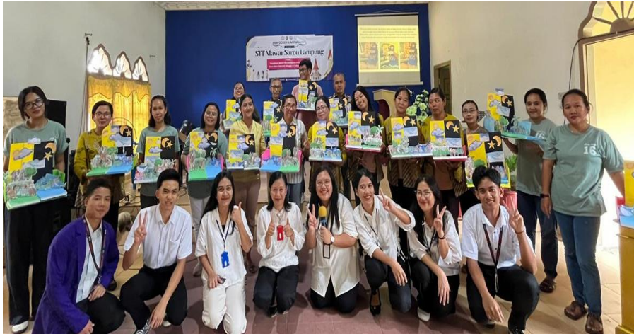
Gambar 9. Presentasi Hasil Proyek Pembuatan Pop Up Book

Demikianpula setelah pembuatan diorama, setiap peserta diberi kesempatan untuk mensimulasikan alat peraga yang sudah dibuat dan Tim PkM memberi hadiah kecil sebagai apresiasi kinerja peserta PkM yang memuaskan. Di bawah ini kami menampilkan lokasi kegiatan PkM yang dilaksanakan di GITJ Pniel