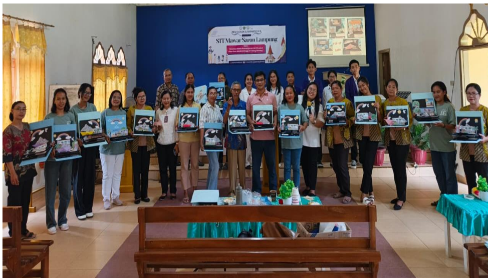
Gambar 8. Presentasi Hasil Proyek Pembuatan Pop-Up Book

Tampak pada gambar 7 di atas, tim mengasah kreativitas guru sekolah minggu dengan praktik games edukatif dan inovatif. Dengan demikian, tidak hanya murid sekolah minggu yang antusias, melainkan guru-guru juga termotivasi dan bersemangat. Games ini juga menghangatkan suasana kegiatan PkM sebelum melakukan praktik pembuatan media pembelajaran.