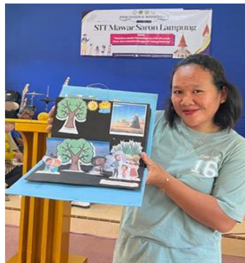
Gambar 3. Hasil Pop up Book Peserta