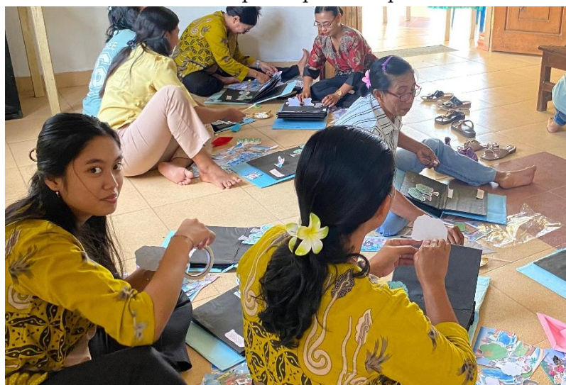
Gambar 4. Praktik Pembuatan Pop Up Book Dalam Kelompok Kerja

Selanjutnya, salah satu sesi utama difokuskan pada praktik pembuatan media pembelajaran tiga dimensi berupa pop-up book . Dalam sesi ini, peserta diajak mendesain pop-up book bertema kisah Nuh dan bahteranya yang diambil dari kitab Kejadian. Kegiatan dimulai dengan penjelasan teknik dasar melipat, memotong, dan menyusun elemen kertas agar dapat membentuk efek tiga dimensi yang muncul ketika halaman dibuka. Peserta kemudian menambahkan ilustrasi