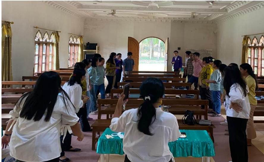
Gambar 7. Kuis Pesan Berantai Ayat Alkitab

Tampak pada gambar 7 di atas, tim mengasah kreativitas guru sekolah minggu dengan praktik games edukatif dan inovatif. Dengan demikian, tidak hanya murid sekolah minggu yang antusias, melainkan guru-guru juga termotivasi dan bersemangat. Games ini juga menghangatkan suasana kegiatan PkM sebelum melakukan praktik pembuatan media pembelajaran.