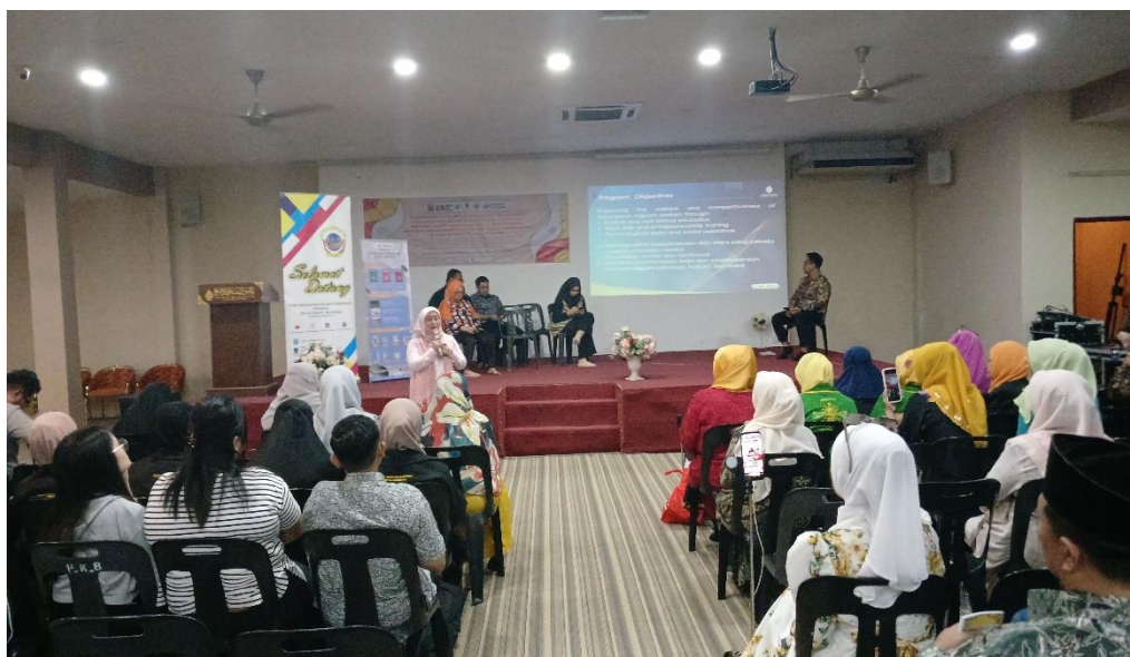
Gambar 3. Peserta Mendengarkan Pemaparan Materi