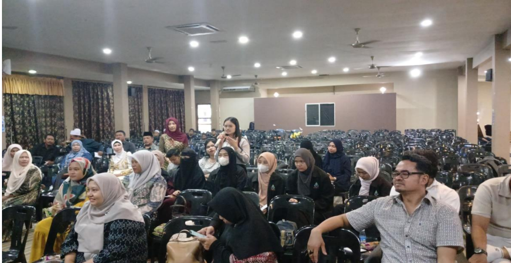
Gambar 4. Peserta Membahas Tantangan Bekerja di Luar Negeri.

Kegiatan pengabdian kepada masyarakat ini dievaluasi melalui sesi tanya jawab dan umpan balik langsung dari peserta setelah seluruh rangkaian pelatihan selesai. Evaluasi bertujuan untuk mengukur sejauh mana pemahaman peserta terhadap materi yang disampaikan, terutama mengenai literasi hukum, hak-hak pekerja migran, dan keterampilan kerja yang relevan dengan kondisi mereka di Malaysia. Hasil evaluasi menunjukkan bahwa sekitar 90% peserta menilai pelatihan bermanfaat, meningkatkan pemahaman mereka tentang hak-hak dasar, pentingnya dokumen hukum, serta prosedur mengakses layanan perlindungan hukum. Peserta juga mengapresiasi sesi diskusi yang memungkinkan mereka berbagi pengalaman dan memperoleh solusi praktis atas permasalahan yang dihadapi.