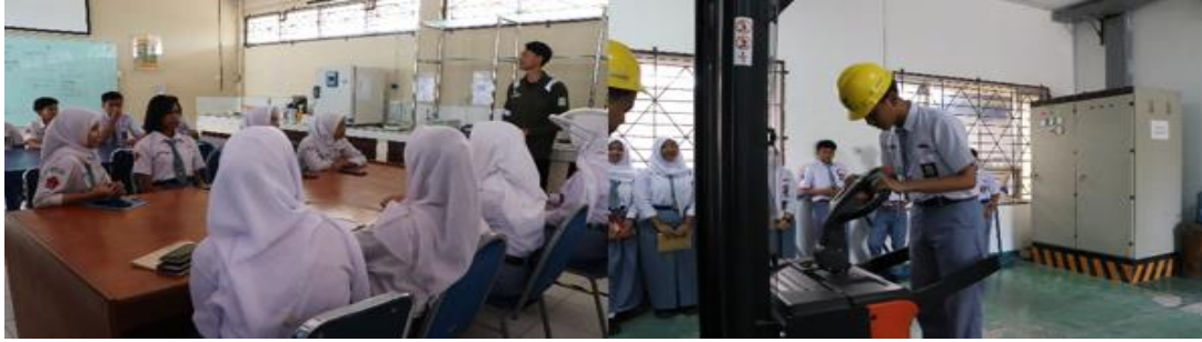
Gambar 11. Kunjungan ke Laboratorium