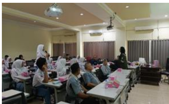
Gambar 9. Diskusi Tanya Jawab