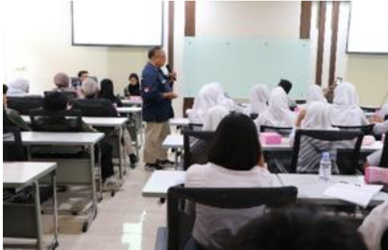
Gambar 7. Pemaparan Materi