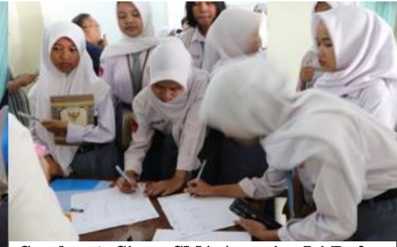
Gambar 2. Siswa SMA Antusias Isi Daftar Hadir Registrasi

Kegiatan dilaksanakan di Kampus PEM Akamigas, Cepu Kabupaten Blora, dengan jumlah peserta 40 Orang. Suasana kegiatan dimulai dengan antusiasme para peserta yang hadir tepat waktu. Mereka langsung melakukan registrasi dengan mengisi daftar kehadiran yang disiapkan oleh panitia. Proses ini berjalan lancar, diiringi suasana ramah dan hangat dari para panitia yang membantu peserta.