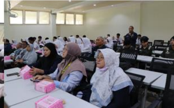
Gambar 8. Peserta Menyimak Secara Aktif

Setelah sambutan, sesi inti berupa pemaparan materi dimulai. Para peserta tampak serius menyimak penjelasan dari narasumber yang berdiri di depan ruangan. Materi yang disampaikan mencakup Kegiatan penerimaan dan penyaluran produk Migas, Pemanfaatan limbah sampah, serta pengujian produk Migas. Suasana ruangan dipenuhi antusiasme peserta, yang terlihat dari perhatian mereka terhadap presentasi yang diberikan. Acara ini tidak hanya memberikan informasi yang bermanfaat tetapi juga menciptakan suasana interaktif dan edukatif bagi para peserta. Penguatan kompetensi sumber daya manusia melalui sharing session dan praktikum laboratorium merupakan strategi efektif dalam memenuhi kebutuhan industri migas yang semakin kompetitif (Efendi and Suhartanta, 2024).