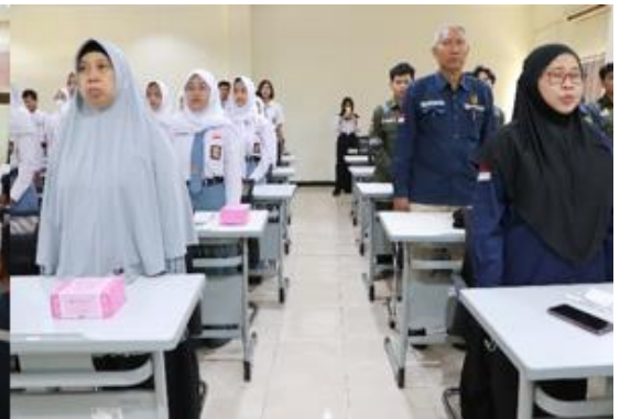
Gambar 4. Menyanyikan Lagu Indonesia Raya

Setelah semua peserta terdaftar, acara resmi dibuka oleh pembawa acara (MC). Dengan penuh semangat, MC menyapa para peserta, memberikan penjelasan singkat mengenai tujuan dan rangkaian kegiatan yang akan berlangsung. Suasana semakin hidup dengan kehadiran peserta yang aktif dan penuh perhatian terhadap setiap tahapan acara.