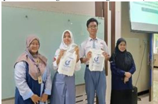
Gambar 13. Pemberian Cendera Mata Kepada Siswa Siswi

Kunjungan dilakukan dengan mengajak peserta mengunjungi beberapa laboratorium terkait quality dan quantity serta warehouse di PEM Akamigas. Peserta diajarkan dan dijelaskan mengenai langkah-langkah menguji produk Migas dan Bagaimana proses penerimaan dan Penyaluran berlangsung. Pendekatan keterlibatan langsung ( participatory engagement ) dalam pengabdian masyarakat terbukti efektif dalam memperoleh data aktual dan memberikan solusi berbasis kebutuhan nyata di lapangan (Kartika et al. , 2025). Studi memperlihatkan bahwa penggunaan pelatihan simulasi laboratorium meningkatkan pemahaman dan keterampilan peserta dalam melakukan pengujian mutu migas secara signifikan (Hakim et al. , 2024).