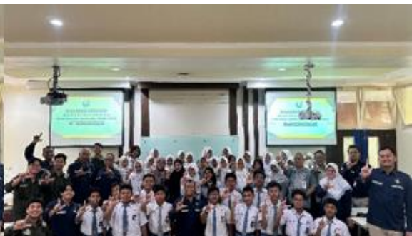
Gambar 16. Foto Kebersamaan dan Komitmen Peserta