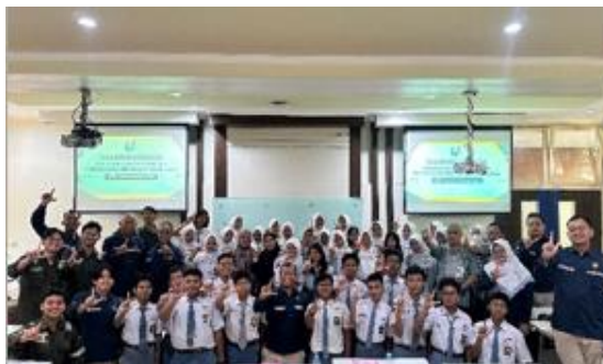
Gambar 15. Foto Penutupan Bersama

Kegiatan diakhiri dengan pemberian penghargaan kepada peserta aktif yang berkontribusi secara signifikan dalam sesi diskusi dan simulasi. Penghargaan berupa paket hadiah diberikan langsung oleh penyelenggara sebagai bentuk apresiasi terhadap partisipasi mereka.