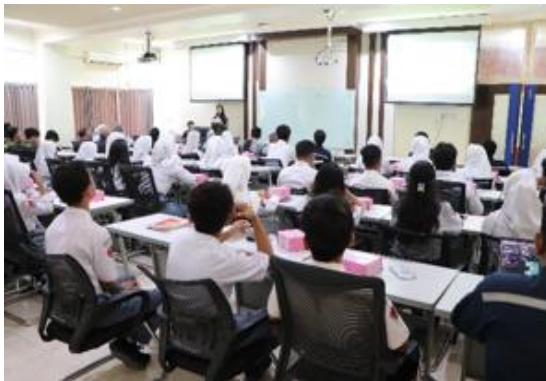
Gambar 3. Pembukaan oleh MC