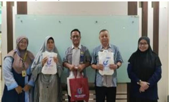
Gambar 14. Pemberian Cendera Mata Kepada Bapak/Ibu Guru