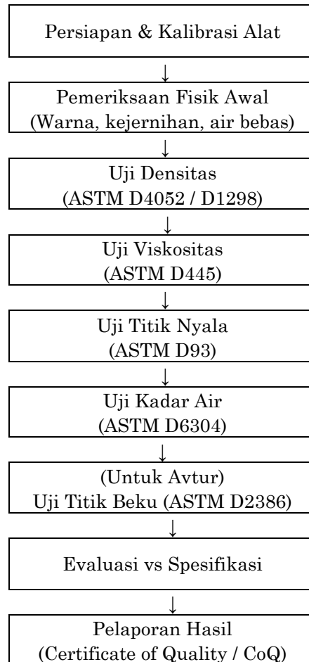
Gambar 3 Bagan Pengujian Sampel di Laboratorium

pengujian dilaporkan dalam bentuk Certificate of Quality (CoQ), yang merupakan dokumen resmi yang mencantumkan parameter dan hasil uji mutu produk migas. Gambar 3. Bagan Pengujian Sampel di Laboratorium diawah ini menunjukkan tahapan pengujian sampel produk migas di laboratorium secara sistematis, mulai dari persiapan alat hingga pelaporan hasil uji mutu.