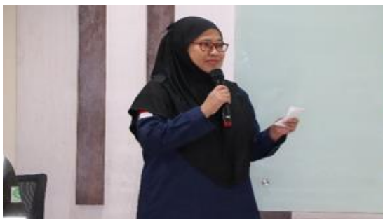
Gambar 5. Kata Sambutan Ketua

Setelah semua peserta terdaftar, acara resmi dibuka oleh pembawa acara (MC). Dengan penuh semangat, MC menyapa para peserta, memberikan penjelasan singkat mengenai tujuan dan rangkaian kegiatan yang akan berlangsung. Suasana semakin hidup dengan kehadiran peserta yang aktif dan penuh perhatian terhadap setiap tahapan acara.