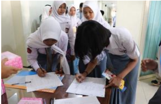
Gambar 1. Kedatangan dan Registrasi