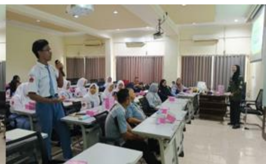
Gambar 10. Diskusi Tanya Jawab

Kegiatan ini melibatkan sesi diskusi tanya jawab dan simulasi praktik tentang Quality dan Quantity pada penerimaan dan penyaluran produk Migas. Diskusi dilakukan secara interaktif, di mana peserta, yang terdiri dari berbagai kalangan, menyampaikan pertanyaan dan ide mereka terkait dengan topik.