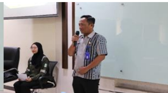
Gambar 6. kata Sambutan dari Perwakilan SMA