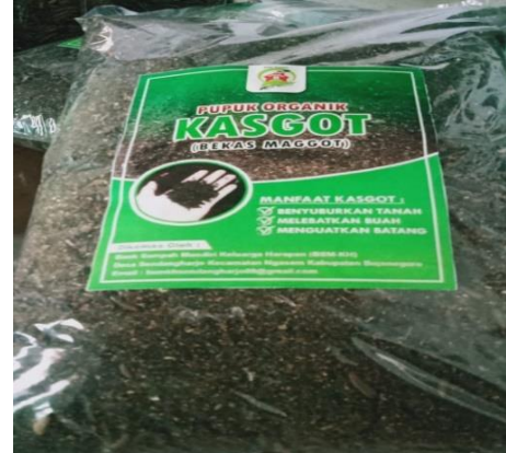
Gambar 8 Residu Hasil Biokonversi Maggot Black Soldier Fly .

Berdasarkan hasil kunjungan dan pengamatan pengelola, diterapkan model Holistik Integrated Sistem (HIS) yang mengintegrasikan pengelolaan sampah organik dengan budidaya maggot, ikan, unggas, dan tanaman dalam satu ekosistem terpadu berbasis prinsip 3R (Reduce, Reuse, Recycle) di Desa Sendangharjo. Pada titik ini, diperkenalkan peralatan yang mendukung pengelolaan sampah organik. Peralatan ini termasuk media budidaya maggot BSF yang digunakan untuk mengurai sampah organik rumah tangga menjadi biomassa maggot dan kasgot. Selain itu, digunakan juga peralatan untuk mengolah cairan hasil samping, yaitu alat destilasi sederhana. Alat tersebut dapat memproses cairan hasil samping untuk meningkatkan nilai gunanya. Peralatan ini menunjukkan upaya untuk mengoptimalkan limbah agar tidak terbuang percuma dan mendukung ekonomi sirkular. Penciptaan dan penerapan model HIS di Desa Sendangharjo bergantung pada informasi yang dikumpulkan dari penggunaan alat ini.