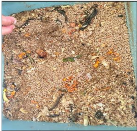
Gambar 7 Maggot ( Black Soldier Fly )