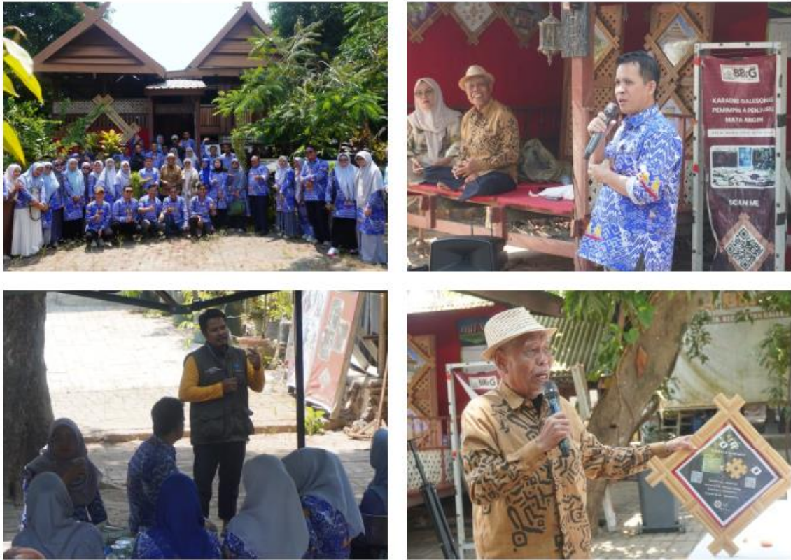
Gambar 4. Diskusi Budaya Bersama Tokoh Adat dan Pemerintah Desa

Selain itu, gambar 4 menunjukkan diskusi budaya bersama tokoh adat memperkuat pemahaman filosofis terhadap simbol dan nilai budaya lokal sebagai dasar integrasi ilmu pengetahuan modern dengan budaya. Pendekatan ini sejalan dengan pandangan bahwa integrasi nilai budaya dalam pengembangan ilmu pengetahuan mampu membangun masyarakat yang adaptif, toleran, dan beretika di tengah tantangan globalisasi dan digitalisasi. Diskusi dan memperdalam pemahaman tentang simbol-simbol budaya dan makna filosofisnya merupakan bekal untuk mendukung upaya integrasi antara nilai karifan lokal dengan ilmu pengetahuan modern. Karena Di era global dan digital, integrasi antara ilmu pengetahuan, kebudayaan, globalisasi dan digitalisasi telah menciptakan tantangan baru, seperti homogenisasi budaya, krisis identitas, dan dilema etika dalam penggunaan teknologi. Dengan mengintegrasikan nilai-nilai budaya dan dalam pengembangan ilmu pengetahuan, masyarakat dapat membangun peradaban yang lebih beradab, toleran, dan adaptif terhadap perubahan zaman. (Palenza, Karneli, and Handayani 2025).