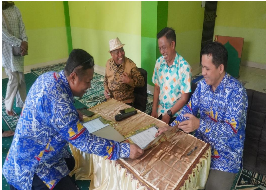
Gambar 2. Penandatanganan MoU Antara Pemerintah Desa Tokoh adat Dan FEB Unismuh Makassar

Pengabdian kepada Masyarakat (PKM) ini dirancang untuk memberikan solusi yang bersifat edukatif, aplikatif, dan kontekstual. Solusi yang ditawarkan tidak hanya berfokus pada peningkatan kapasitas teknis, tetapi juga pada penguatan tata kelola dan integrasi nilai budaya lokal dalam pengelolaan keuangan desa berbasis Akuntansi dan audit internal sebagai kekuatan administratif yang berdampak.