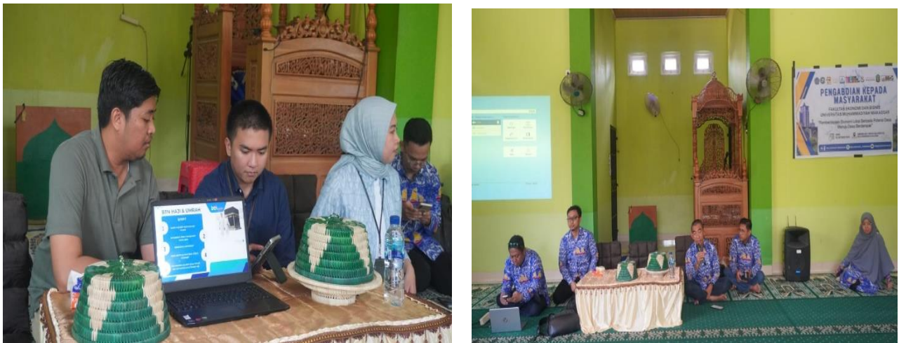
Gambar 3. Penyampaian Materi dengan Ceramah sambil melakukan Simulasi

transparansi dan akuntabilitas dalam pengelolaan keuangan desa. Model akuntansi dan audit internal yang dikembangkan dirancang untuk menjembatani praktik akuntansi modern dengan kearifan lokal, sehingga sistem pengelolaan keuangan desa tidak hanya efektif secara administratif, tetapi juga diterima secara sosial dan berkelanjutan. Model ini dirancang untuk menjembatani praktik akuntansi modern dengan kearifan lokal, sehingga sistem pengelolaan keuangan desa tidak hanya efektif secara administratif, tetapi juga diterima secara sosial dan berkelanjutan. Secara keseluruhan, solusi yang ditawarkan dalam kegiatan PKM ini diharapkan mampu memperkuat tata kelola keuangan desa yang akuntabel, transparan, dan berbasis budaya lokal, sehingga masyarakat adat dan aparatur desa dapat berkolaborasi dalam menyusun laporan keuangan desa yang berdampak bagi pembangunan dan kesejahteraan masyarakat Kampung Adat Balla Barakkaka ri Galesong. Gambar 3 menunjukkan pemberian materi dan diskusi terkait aplikasi keuangan yang dibuat.