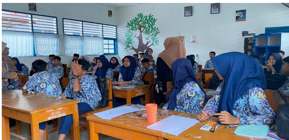
Gambar 2. Siswa Mendengarkan Instruksi Tes Menulis Cerpen untuk Pre-Test

memiliki model mental yang konkret tentang bagaimana sebuah alur cerita yang baik itu dibangun.