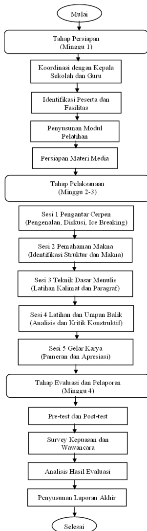
Gambar 1. Flowchart Kegiatan Pengabdian