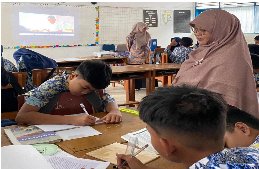
Gambar 4. Siswa Menulis Teks Cerpen

Peningkatan signifikan pada hasil post-test bukanlah sekadar peningkatan skor, melainkan cerminan dari perubahan cara berpikir siswa saat menulis. Pada tahap ini, siswa tidak lagi menulis secara spontan dan tanpa arah. Tulisan mereka menunjukkan adanya kesadaran dan intensi untuk membangun cerita secara sistematis. Mereka secara sadar membuat bagian pengenalan, menggiring cerita menuju konflik, dan berusaha memberikan penyelesaian yang logis. Dengan kata lain, media audio visual tidak hanya memberikan hiburan, tetapi juga memberikan kerangka berpikir visual yang mereka adopsi ke dalam proses kreatif mereka. Keberhasilan ini menegaskan bahwa untuk mengajarkan keterampilan menulis yang bersifat prosedural seperti mengikuti struktur, memberikan contoh konkret yang dapat dialami secara multi-sensori (visual dan audio) jauh lebih efektif daripada sekadar memberikan instruksi teoretis.