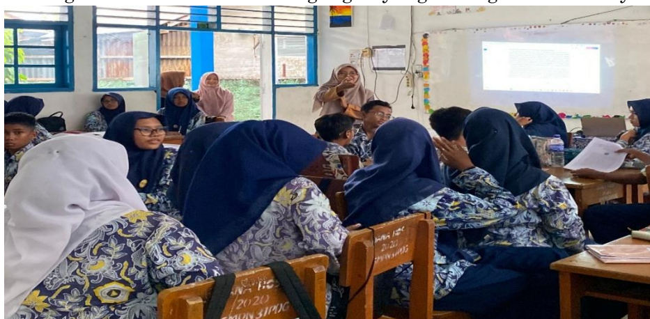
Gambar 3. Siswa Antusias dalam Kegiatan Diskusi

Ketika adegan konflik mulai muncul dan memuncak, siswa dapat merasakan ketegangannya. Inilah momen konsep komplikasi tidak lagi hanya sebuah definisi di buku, melainkan sebuah pengalaman emosional yang bisa dirasakan. Demikian pula dengan resolusi, siswa menyaksikannya sebagai sebuah adegan penutup yang memberikan kelegaan atau akhir dari ketegangan yang dibangun sebelumnya.