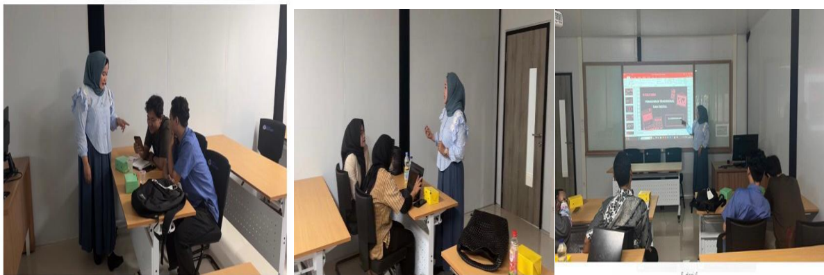
Gambar 3. Pelatihan Secara Langsung Penerapan Pemilihan HR Dan Metode Pemilihan Dengan Cara Memasarkan Secara Digitalisasi.