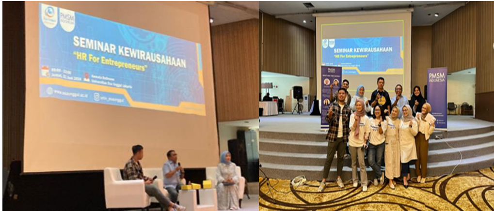
Gambar 2. Memberikan Materi Seminar HR For Entrepreneur