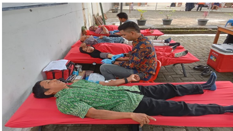
Gambar 2. Proses pengambilan darah

Pendaftaran Peserta, Pengecekan medis berupa tekanan darah, golongan darah, pemeriksaan hemoglobin hingga proses wawancara terkait rekam medis