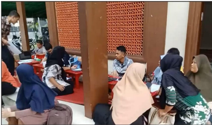
Gambar 2. Registrasi dan pemeriksaan

Kegiatan dilaksanakan pada hari Jum'at, 26 Oktober 2025, pukul 09.00 - 15.00 WIB, bertempat di halaman Masjid Al-Ikhlash, Jalan Kowilhan Gang Masjid No. 1 Desa Sidirejo, Kecamatan Namorambe, Kabupaten Deli Serdang. Pemilihan lokasi di masjid bertujuan untuk memanfaatkan momentum keagamaan dan memberikan kenyamanan psikologis bagi calon pendonor. Kegiatan donor darah berlangsung tertib dan lancar. Meskipun terdapat kendala teknis berupa keterbatasan waktu dalam menginformasikan ke masyarakat sehingga sebagian peserta baru mengetahui kegiatan menjelang pelaksanaan, antusiasme masyarakat tetap tinggi. Tim medis dari (Palang Merah Indonesia (PMI) Deli Serdang berjumlah 8 orang melayani pemeriksaan dan pengambilan darah. Sebelum donor, tim pelaksana memberikan edukasi singkat mengenai manfaat donor darah dari sisi kesehatan (regenerasi sel darah merah, deteksi dini penyakit) dan nilai sosial-keagamaan (pahala tolong-menolong).